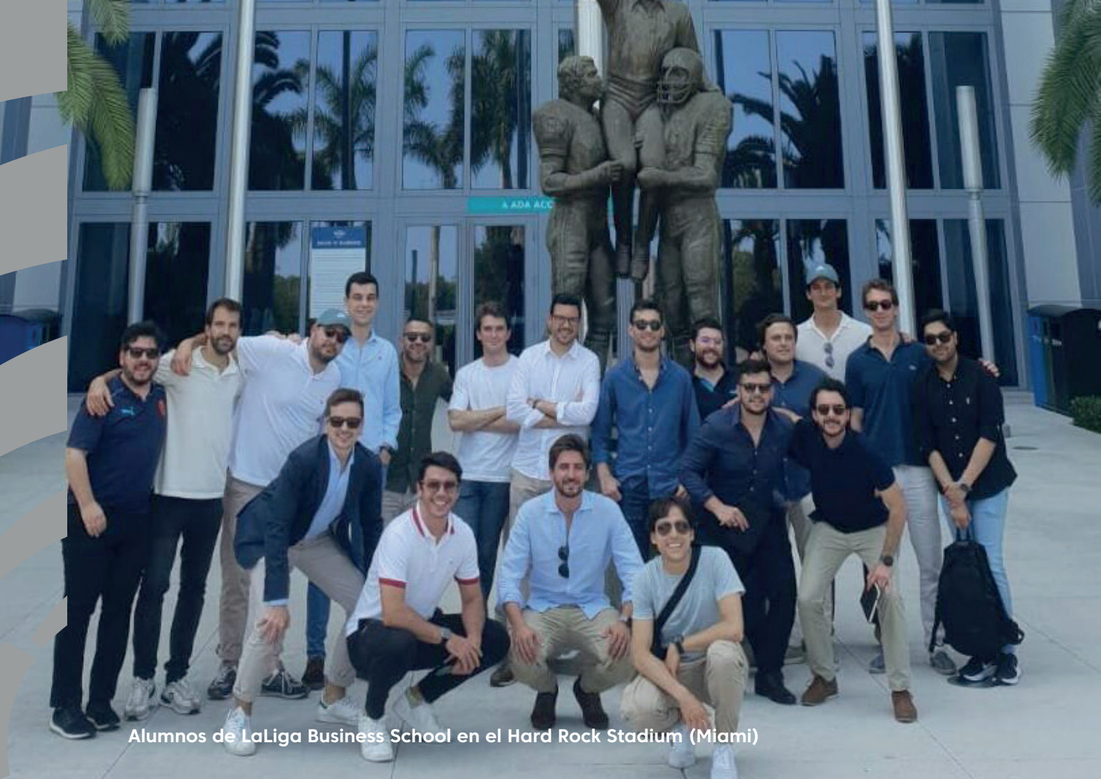
Alumnos de LaLiga Business School en el Hard Rock Stadium (Miami)