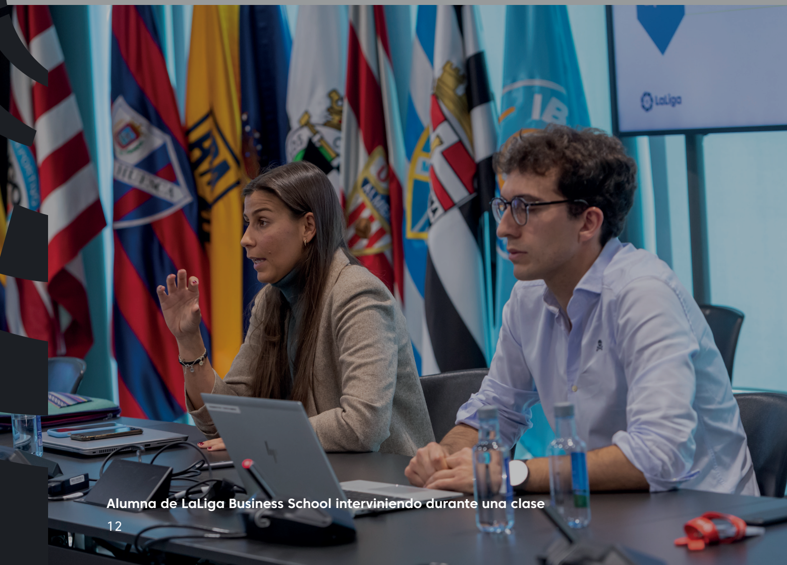
Alumna de LaLiga Business School interviniendo durante una clase