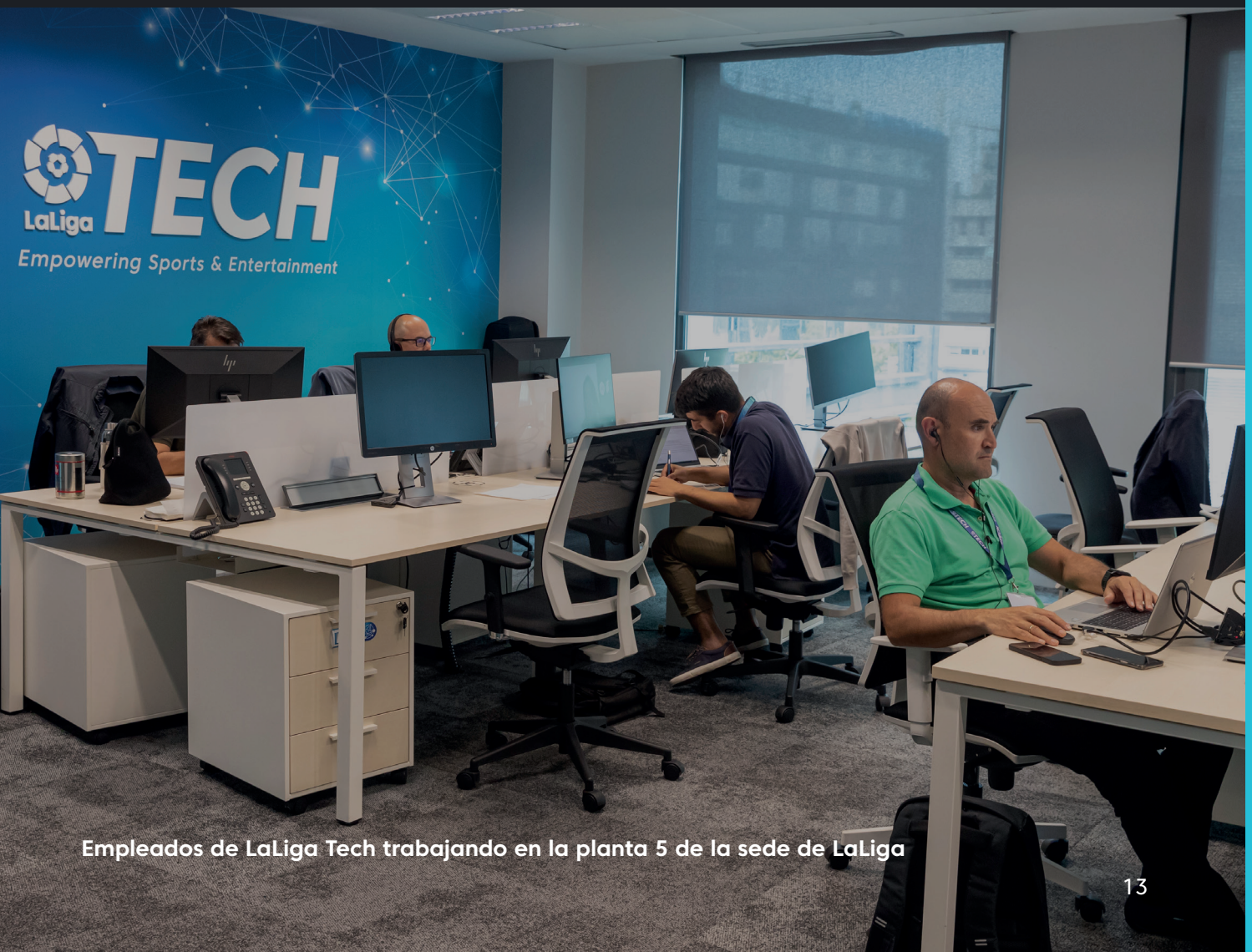
Empleados de LaLiga Tech trabajando en la planta 5 de la sede de LaLiga