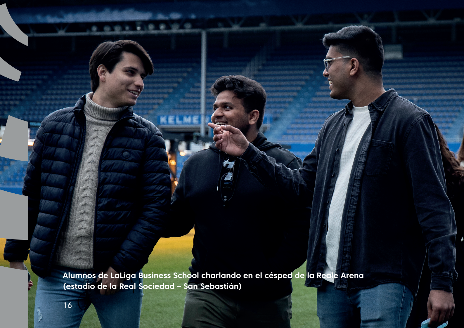
Alumnos de LaLiga Business School charlando en el césped de la Reale Arena (estadio de la Real Sociedad – San Sebastián)