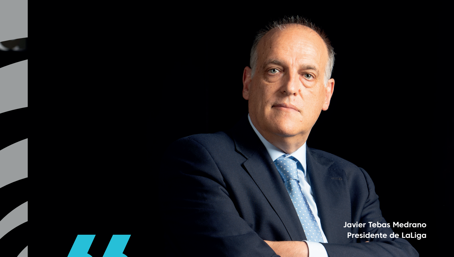
Javier Tebas Medrano Presidente de LaLiga