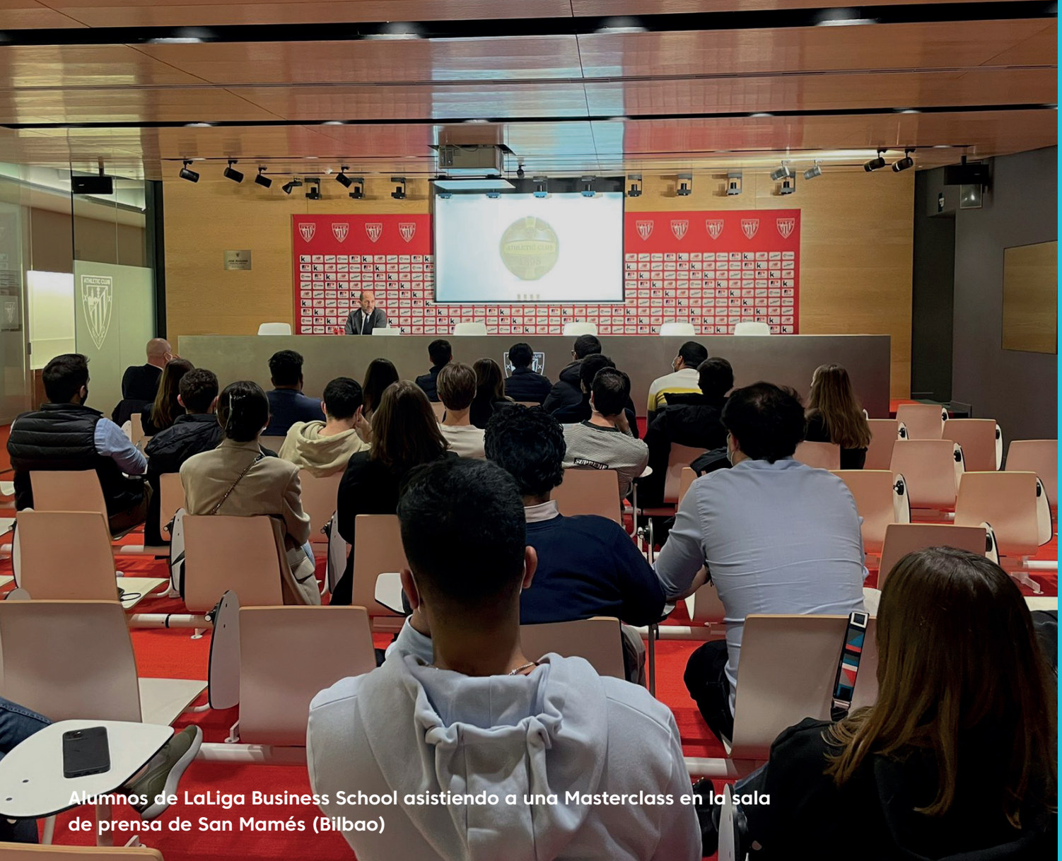
Alumnos de LaLiga Business School asistiendo a una Masterclass en la sala de prensa de San Mamés (Bilbao)